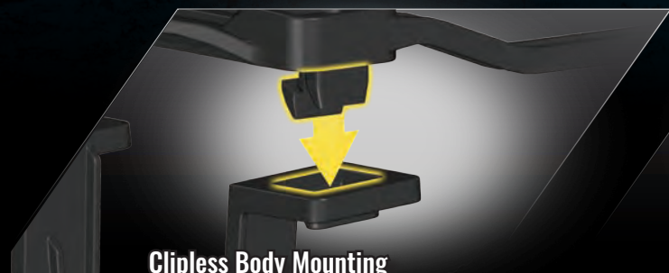
Clipless Body Mounting