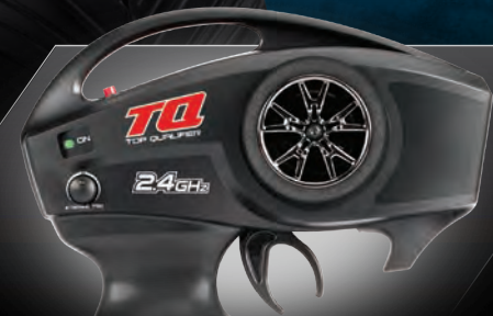
TQ™ 2.4GHz Radio System