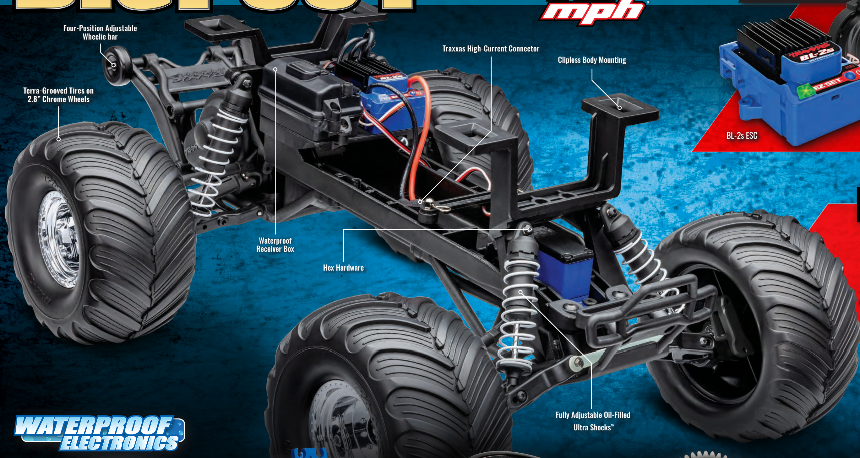
Four-Position Adjustable Wheelie bar