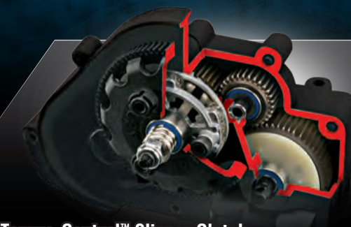
Torque-Control™ Slipper Clutch