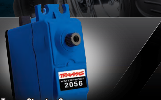
High-Torque Steering Servo